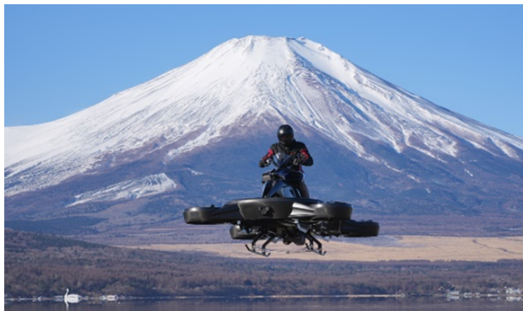
XTURISMO Limited Edition (AERWINS Technologies Inc)